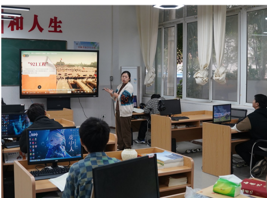
特殊学生正在上课

“最开始成立特殊教育班的时候,全校的干部分别到全市各区县走访入户寻找合适的学生,帮助其继续学习。并且,学校对于特殊学生,专门将其宿舍设置在一楼,还为之请了一名专职生活老师,设置了专门的心理咨询室。未来,‘善和社会技能培训基地’将继续以‘以人为本、关爱残疾’为理念,不断完善设施和服务,为更多的残疾人学生